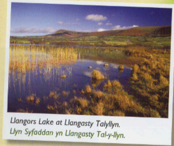
Llangors Lake at Llangasty Tallylyn. Llyn Syfaddan yn Llangasty Tal-y-llyn.

3 miles/5km out and back. A gentle walk through fields around the western side of the lake, to the historic church at Llangasty Tallylyn. (This walk is best in summer as the lake often floods in winter).